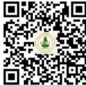
中国老年医学和老年健康产业大会